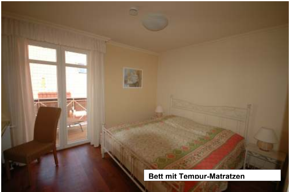
Bett mit Tempur-Matratzen