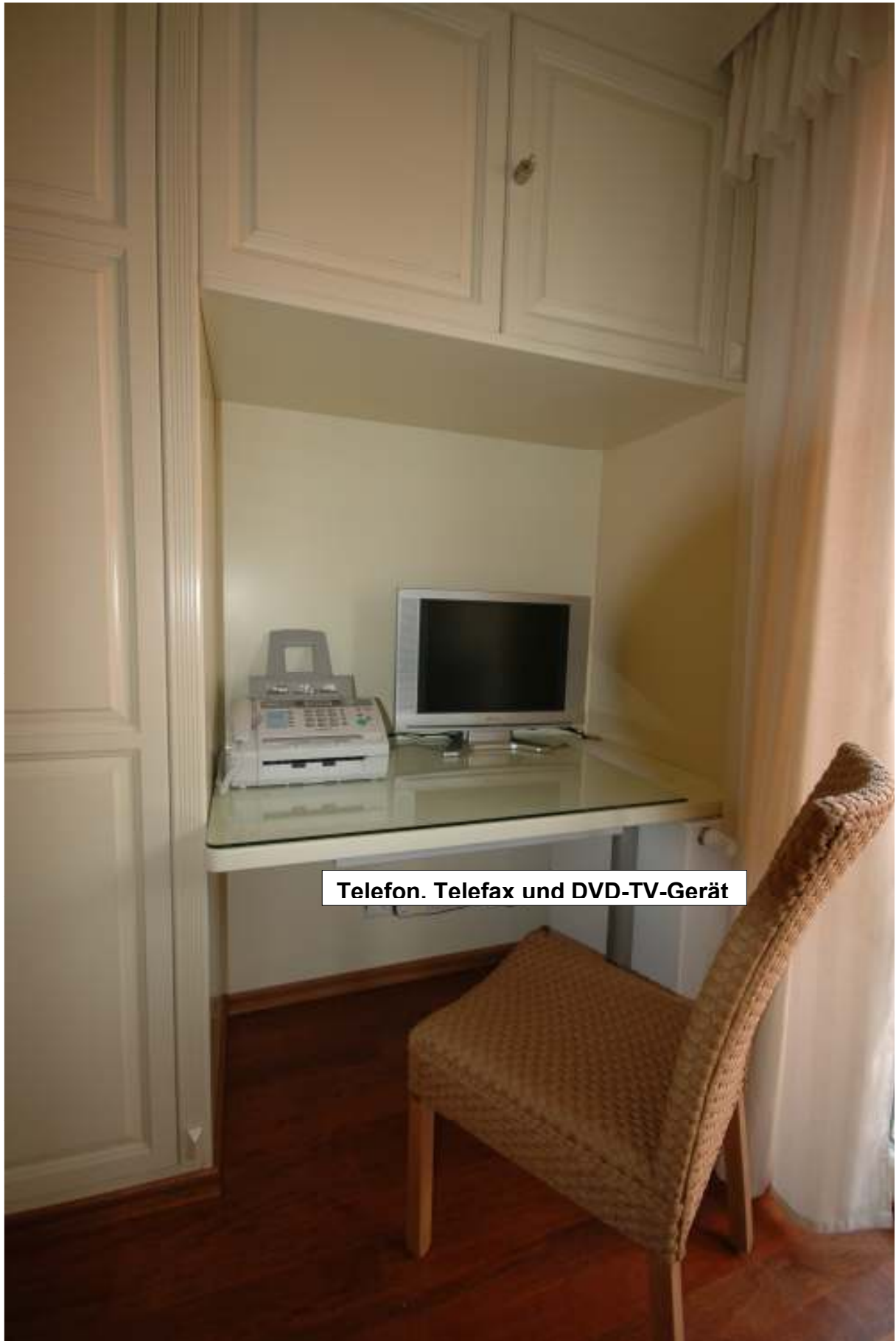
Telefon. Telefax und DVD-TV-Gerät