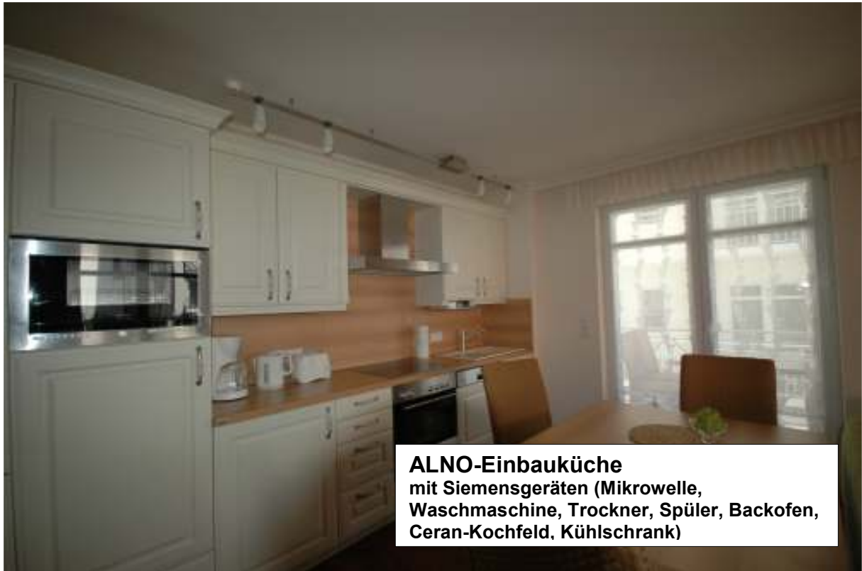
ALNO-Einbauküche mit Siemensgeräten (Mikrowelle, Waschmaschine, Trockner, Spüler, Backofen, Ceran-Kochfeld, Kühlschrank)