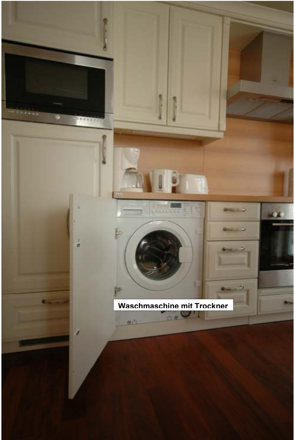
Waschmaschine mit Trockner