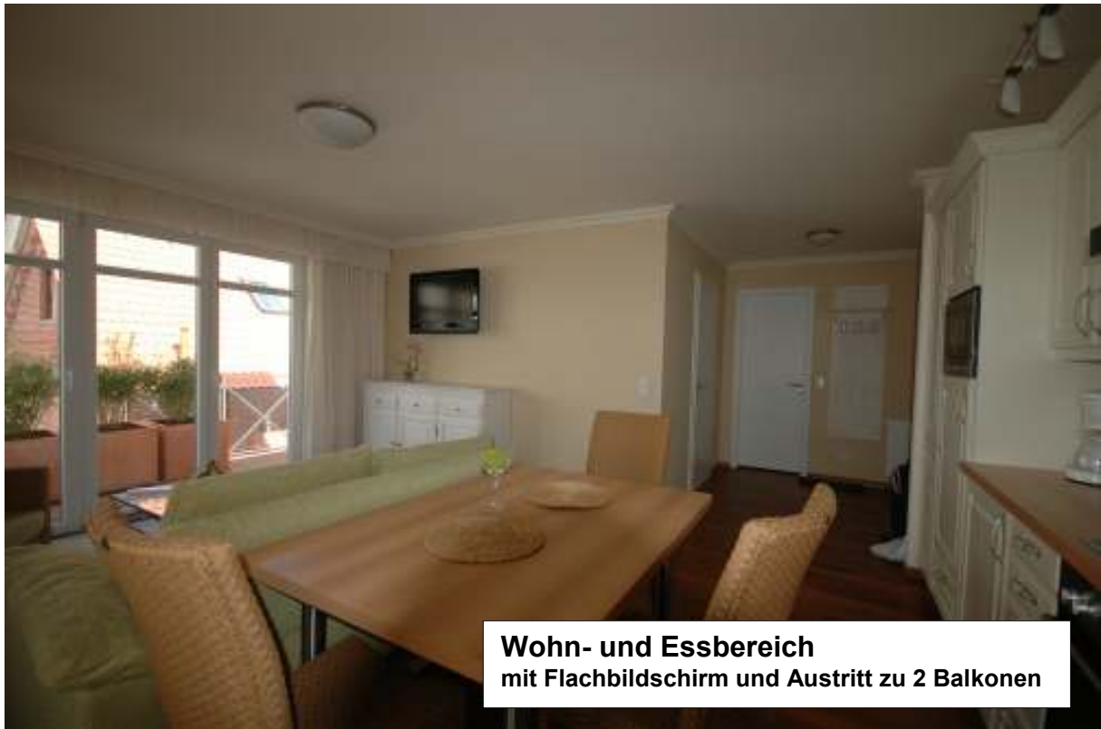
Wohn- und Essbereich mit Flachbildschirm und Austritt zu 2 Balkonen