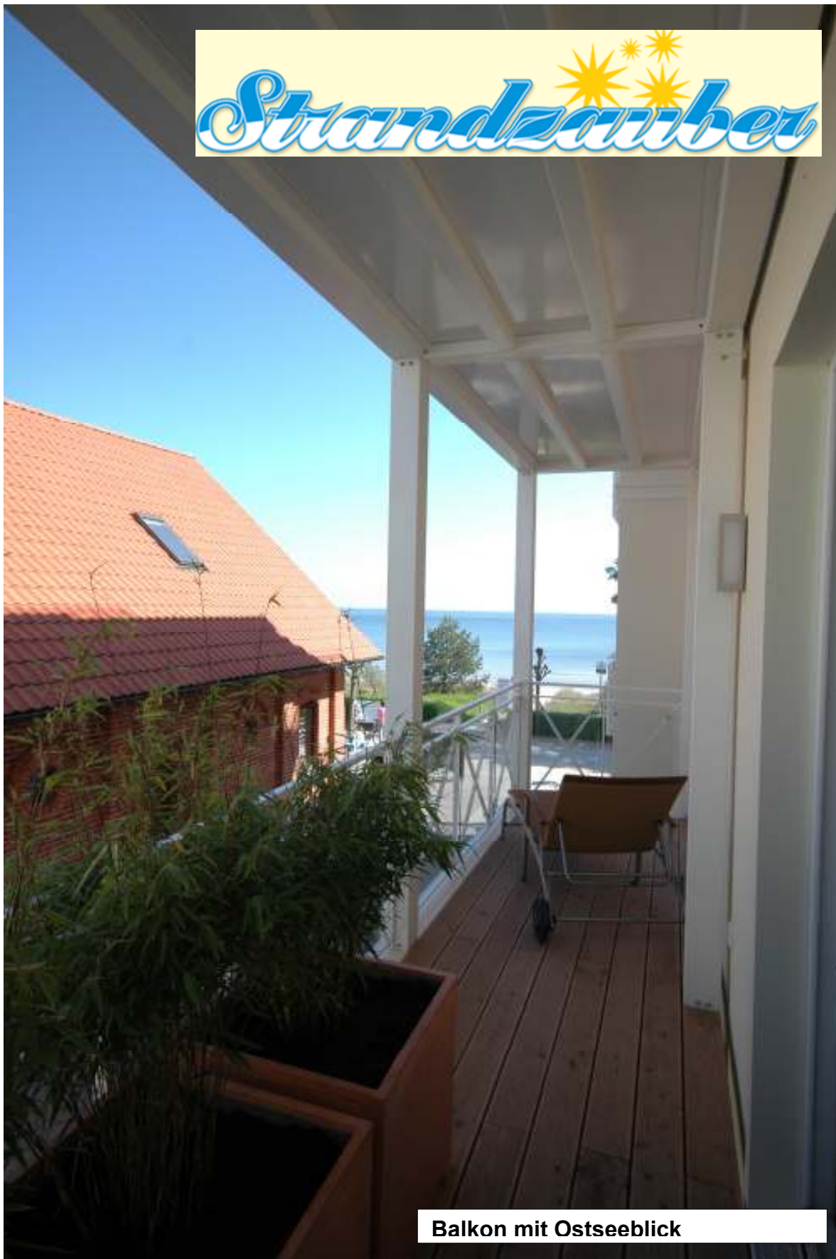
Balkon mit Ostseeblick